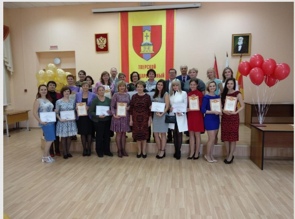
Преподаватели гимназии 2019 г.

Учебно-воспитательный процесс в гимназии реализуют лучшие преподаватели университета с научным потенциалом, и, что немаловажно, опытом работы со школьниками. Многие из имен этих педагогов широко известны в Тверской области.