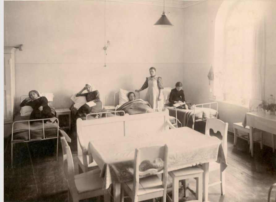
Больничка в школе