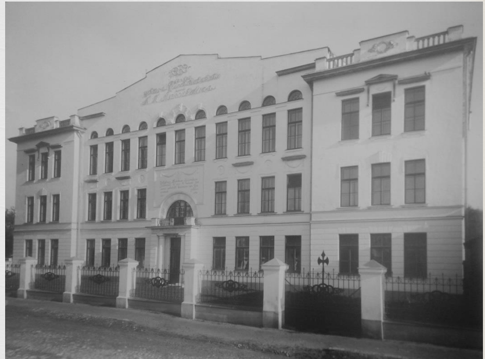
Второй корпус Школы П.П. Максимовича, 1910 г.

Школа Максимовича была первым в Тверской губернии средним специальным учебным заведением, сориентированным на подготовку кадров народного образования.