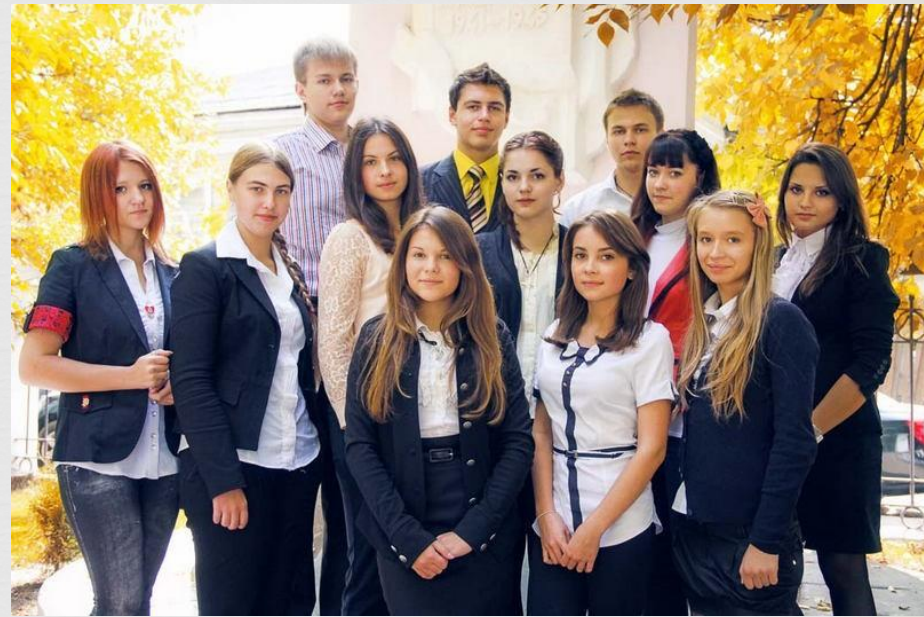
Первые гимназисты 2012 г.

Первый набор включал в себя 9 гимназистов-десятиклассников. С первого же года существования гимназические классы были ориентированы на профильное обучение старшеклассников.