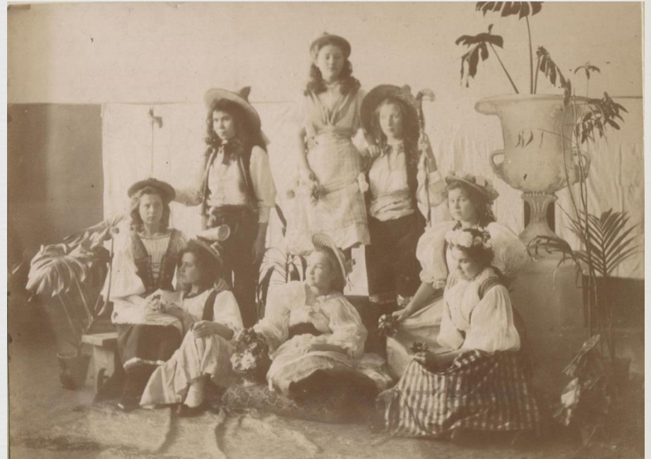
Сцена из школьного спектакля. Мольер. «Мещанин во дворянстве»

Во внеклассной жизни «максимовок» много место уделялось эстетическому воспитанию. В воскресные вечера в большом зале устраивались танцы, лекции о русских и зарубежных художниках, композиторах, концерты, спектакли.