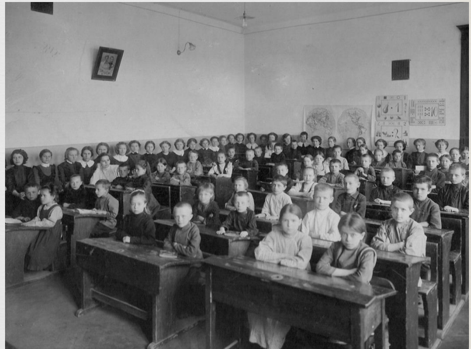
Ученицы школы Максимовича на практике в начальной школе