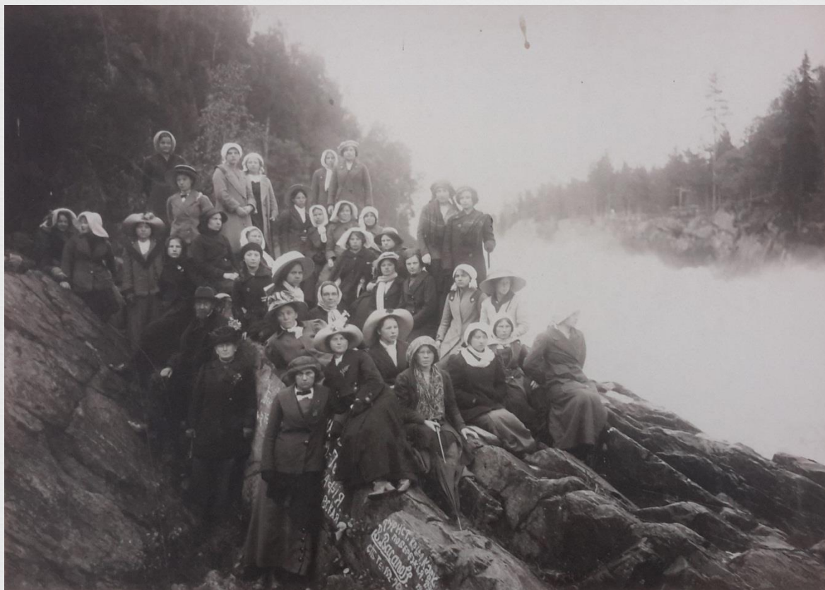
Ученицы на экскурсии в Финляндии