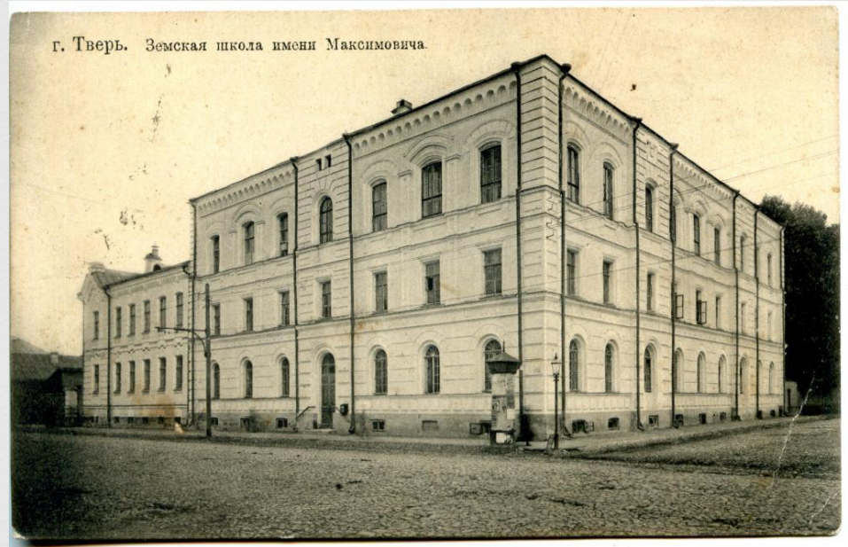
Здание Школы П.П. Максимовича

1 декабря 1870 г. член губернской земской управы Павел Павлович Максимович, дворянин, помещик Кашинского уезда из села Спасское на собственные средства открыл в Твери женскую школу для подготовки народных учительниц. Это было знаковое событие и в деле развития народного просвещения, и в истории педагогического краеведения Тверского края.